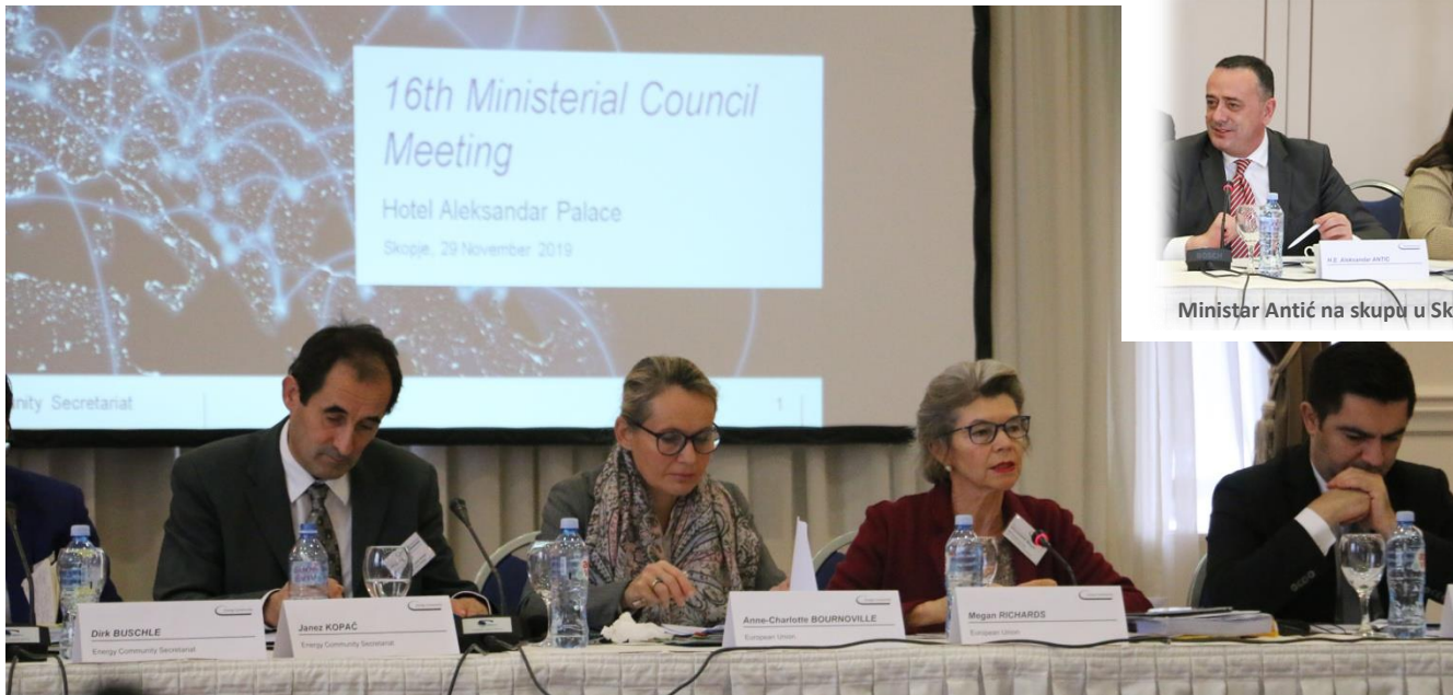
Ministar Antić na skupu u Skoplju

SKOPLJE - Kao podsticaj za integraciju regionalnog energetskeg tržišta, Savet ministara Energetske zajednice usvojio je na prošlonedeljnom sastanku u Skoplju listu na kojoj je 21 infrastrukturni projekat od regionalnog značaja, naglašavajući da će njihova realizacija takođe povećati sigurnost snabdevanja energijom, energetske efikasnost i dopremanje energije iz obnovljivih izvora.