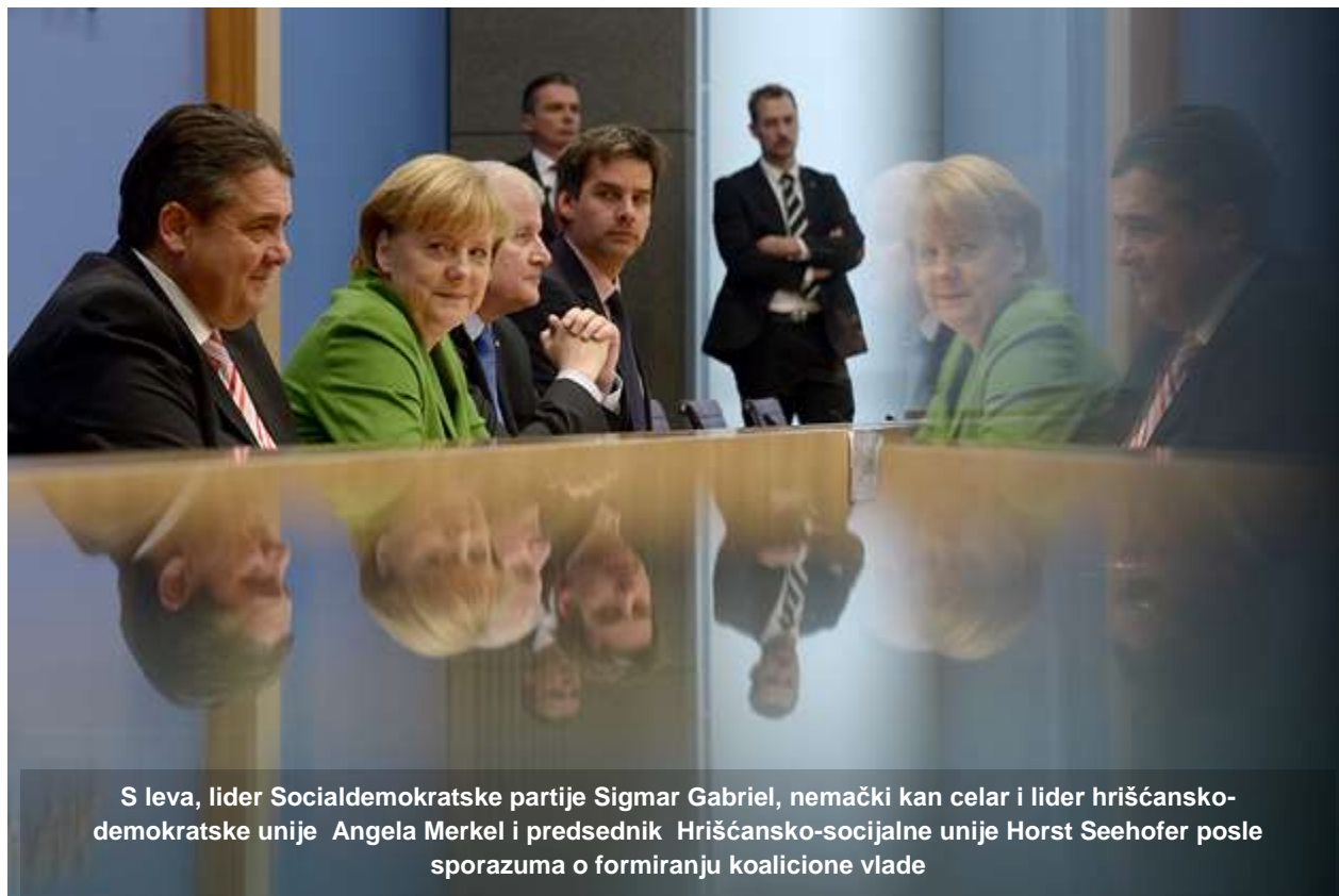
S leva, lider Socijaldemokratske partije Sigmar Gabriel, nemački kan celar i lider hrišćansko-demokratske unije Angela Merkel i predsednik Hrišćansko-socijalne unije Horst Seehofer posle sporazuma o formiranju koalicione vlade

BERLIN - Predsednik nemačke Socijaldemokratske partije (SPD) Sigmar Gabriel biće biće novi ministar energije i privrede te zemlje, objavio je 14. decembra – ne precizirajući izvor – Der Spiegel, odmah pošto je SPD pristao na formiranje crno-crvene koalicije sa Hrišćansko-demokratskom unijom (CDU) Angele Merkel i bavorskom Hrišćansko-socijalnom unijom (CSU), piše Bloomberg . Merkel (59) počinje svoj novi, treći uzastopni mandat u utorak kada će saopštiti i sastav vlade.