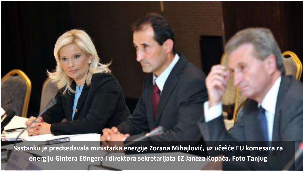
Sastanku je predsedavala ministarka energije Zorana Mihajlović, uz učešće EU komesara za energiju Gintera Etingera i direktora sekretarijata EZ Janeza Kopača.

BEOGRAD - Ministarski savet Energetske zajednice (EZ), usvojio je 24. oktobra u Beogradu listu od 35 projekata od interesa za EZ (PECI), kao i odluku o produžetku trajanja Ugovora o EZ za period od deset godina. PECI obuhvataju 14 projekata iz oblasti proizvodnje električne energije, devet iz infrastrukture za električnu energiju, gasna infrastruktura obuhvata deset a naftna dva projekta. Projekti će dobiti investicione podsticaje, a imaće i poboljšane regulatorne uslove. Ministarski savet je potvrdio važnost usvajanja i primene "Trećeg energetskeg paketa" i doneo dve važne odluke u cilju daljeg ograničavanja emisija iz elektrana sa velikim ložištima. Ministri su odlučili da se produži trajanje Ugovora o EZ za period