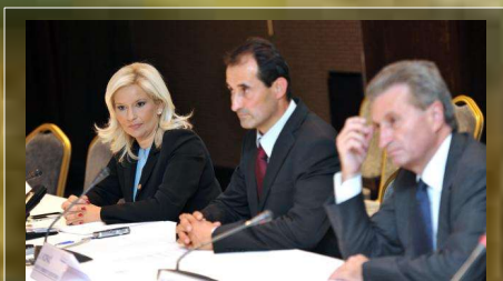
MINISTARSKI SASTANAK EZ