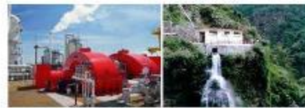
An Overview of the Renewable Energy Market in Romania

BUKUREŠT : Nesolventna rumunska državna elektroenergetska kompanija Hidroelectrica planira da investira 130 miliona evra u mini hidroelektrane u narednim godinama, kako bi ostvarila beneficije od zelenih certifikata koje država daje proizvođačima energije iz alternativnih izvora, objavljuje 13. decembra bukureštanski poslovnik Romania-insider . Kompanija, koja je pod stečajnom upravom, očekuje od ovoga ekstra zaradu od 165 evra po svakom proizvedenom megavatu, a time i brz povraćaj investicije, rekao je stečajni upravnik Remus Borza. Pomenuta investicija, naime, treba kompaniji da donese višak godišnjeg prihoda od 14,2 miliona evra od trgovine zelenim certifikatima. Sistem zelenih certifikata je način na koji rumunska vlada potstiče državne kompanije da ulažu u OIE. Investitori ih dobijaju besplatno i potom ih mogu prodavati snabdevačima energije, piše list.