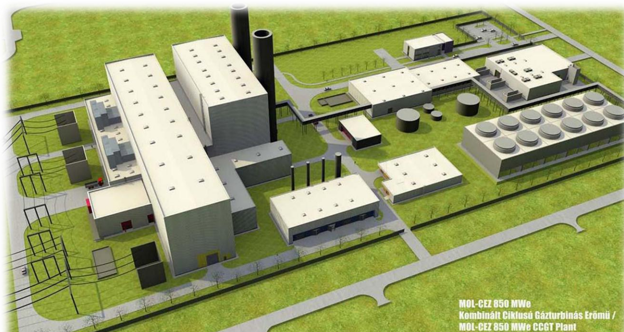
MOL-CEZ 850 MWe Kombinált Ciklusú Gázturbinás Erőmű / MOL-CEZ 850 MWe CCGT Plant

BUDIMPEŠTA – MOL grupa će sa partnerom, češkim ČEZ-om iduće godine doneti odluku o gradnji planirane elektrane u Mađarskoj, rekao je 14. novembra finansijski direktor mađarske