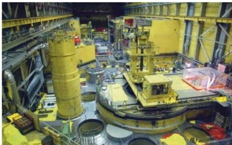
Turbina reaktora Broj 4 u nuklearki Pakš, istočno od Budimpešte

BRISEL - Evropska komisija smatra da mađarska vlada nije u celosti