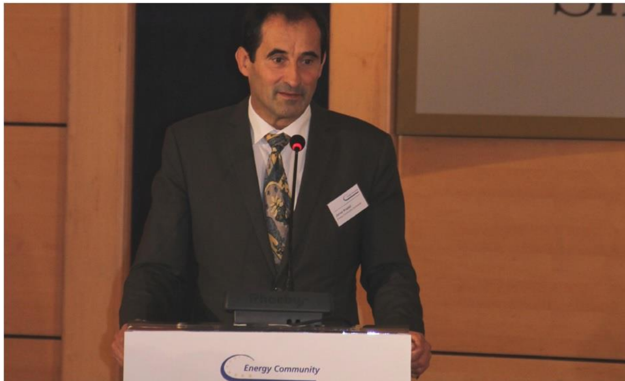
Na sastanku u Tirani direktor Sekretarijata Energetske zajednice Janez Kopač je dobio još jedan trogodišnji mandat na čelu te organizacije, počev od 1. decembra 2015. godine.

Kao posebno značajno istaknuto je usvajanje predloga grupe visokog nivoa za razmatranje reformi Energetske zajednice, što će omogućiti unapređenje procedure za rešavanje sporova, ali i veće uključivanje javnosti u rad Zajednice kroz uspostavljanje Parlamentarnog plenuma Energetske zajednice i saradnju sa organizacijama civilnog društva. "Energetska zajednica postaje integralni deo i partner šire Energetske unije. Radimo zajedno ne samo na efikasnoj trgovini, već na zajedničkom energetsom sistemu koji treba svim Evropljanima da omogući pouzdan i konkurentan pristup energiji", rekao je evropski komesar na otvaranju 13. ministarskog sastanka EnZ u Tirani.