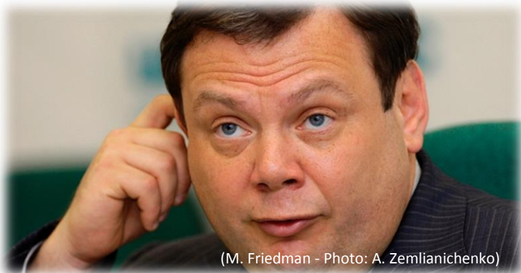
(M. Friedman)

LUKSEMBURG, LONDON - Nemačka naftna i gasna kompanija, RWE Dea AG, prodana je u ponedjeljak ruskoj grupaciji LetterOne sa sedištem u Luksemburgu za 5,1 milijardi USD. Na čelu LetterOne nalazi se ruski oliharg Mihail